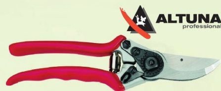
TIJERA 1 MANO ALUMINIO ALTUNA

Ref. PG0195 | 14,79 € + IVA = 17,90 € | Ref. 16.3