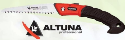
SERRUCHO PLEGABLE PODA ALTUNA 180 mm. Dentado japonés. Para madera verde y seca. Interior de empuñadura de aluminio. Ref. 29623 | 13,64 € + IVA = 16,50 € | Ref. 16.38