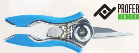
TIJERA PODAR 1 MANO PROFER GREEN

Ref. PG0255 | 7,40 € + IVA = 8,95 € | Ref. 16.13