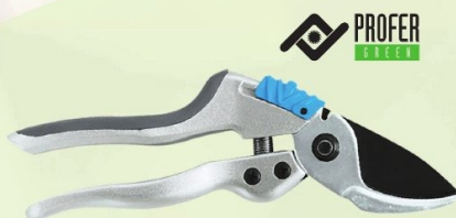
TIJERA PODAR 1 MANO CON YUNQUE PROFER GREEN

Ref. 3501-22BL | 13,97 € + IVA = 16,90 € | Ref. 16.89