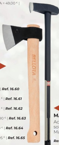
MAZA-CUÑA BELLOTA Acero especial Bellota. Forjada en una sola pieza con tratamiento térmico 3+. Mango de fibra de carbono. Ref. 5460-3 CF | 62,77 € + IVA = 75,95 € | Ref. 16.57