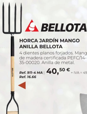
HORCA JARDÍN MANGO ANILLA BELLOTA 4 dientes planos forjados. Mango de madera certificada PEFC/14-35-00020. Anilla de metal. Ref. 911-4 MA | 40,50 € + IVA = 49,00 € | Ref. 16.66