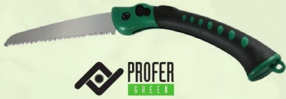
SERRUCHO PODA PLEGABLE PROFER GREEN Hoja 19 cm. Ref. PG0262 | 8,26 € + IVA = 9,99 € | Ref. 16.12