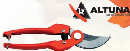
TIJERA 1 MANO J469 ALTUNA ADVANCED

Ref. PG0193 | 9,92 € + IVA = 12,00 € | Ref. 16.1