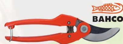
PODADERA 1 MANO TRADICIONAL BAHCO

Ref. PG-12-F | 11,53 € + IVA = 13,95 € | Ref. 16.185