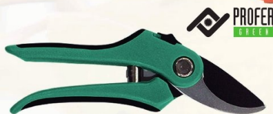
TIJERA PODAR BIMATERIA 1 MANO PROFER GREEN 20,5 CM