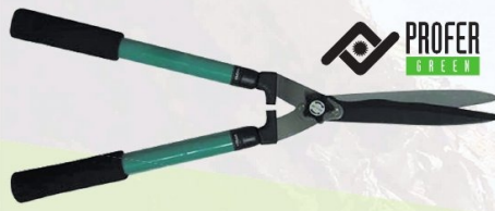
TIJERA CORTASETOS MANGO TELESCÓPICO PROFER GREEN 65-82 cm. Ref. PG0260 | 16,88 € + IVA = 19,95 € | Ref. 16.14