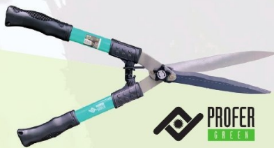
TIJERA CORTASETOS PROFER GREEN 55 cm. Ref. PG0259 | 12,40 € + IVA = 15,00 € | Ref. 16.7