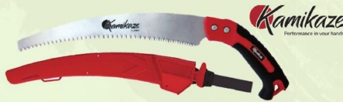
SERRUCHO CURVO CON FUNDA S-330-H KAMIKAZE Hoja curva 330 mm. Funda y mango de poliamida revestido de goma. Afilado japonés con diente templado. Ref. 2981 | 14,01 € + IVA = 16,95 € | Ref. 16.177