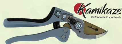
TIJERA PODAR 1 MANO KM-1M FORCE KAMIKAZE

Ref. BR4180 | 14,83 € + IVA = 17,95 € | Ref. 16.67