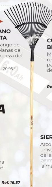
ESCOBA DIENTE PLANO CON MANGO BELLOTA Escoba de jardín, con mango de madera FSC, con púas planas de acero resistente para limpieza del césped. Ref. 3041 CM | 17,31 € + IVA = 20,95 € | Ref. 16.72