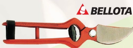
TIJERA PROLINE 1 MANO UNIVERSAL BELLOTA

Ref. P126-22-F - 22 cm | 16,49 € + IVA = 19,95 € | Ref. 16.189