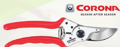
TIJERA PODAR 1 MANO ALUMINIO MAX CORONA

Ref. P110-23-F - 23 cm | 26,36 € + IVA = 31,90 € | Ref. 16.187