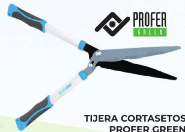
TIJERA CORTASETOS PROFER GREEN 21 cm. Cuchillas revestidas con anti-adherente, con acabado ondulado para un corte suave y eficaz. Corte sin esfuerzo mediante palanca. Mangos transpirables para una sujeción segura. Ref. PG0199 | 28,93 € + IVA = 35,00 € | Ref. 16.5