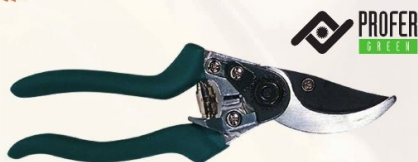
TIJERA PODAR 1 MANO PROFER GREEN

Ref. PG0746 | 6,57 € + IVA = 7,95 € | Ref. 16.8