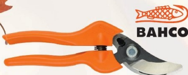
PODADERA 1 MANO BAHCO

Ref. J469-22 - 22 cm | 12,19 € + IVA = 14,75 € | Ref. 16.33