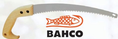
SERRUCHO DE PODA MANGO MADERA BAHCO Dentado templado. 280 mm. Ref. 4211-11-6T | 13,18 € + IVA = 15,95 € | Ref. 16.202