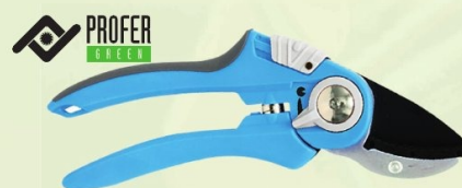
TIJERA PODAR 1 MANO PROFER GREEN

Ref. PG0194 | 13,97 € + IVA = 16,90 € | Ref. 16.2