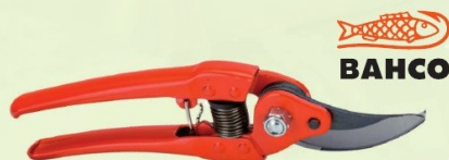
PODADERA 1 MANO PROFESIONAL BAHCO

Ref. 10930 | 20,58 € + IVA = 24,90 € | Ref. 16.179