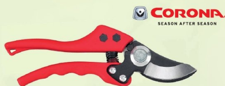
TIJERA PODAR 1 MANO CORONA

Ref. J465 | 14,83 € + IVA = 17,95 € | Ref. 16.34