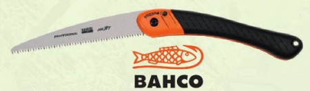
SERRUCHO PLEGABLE DIENTE JAPONÉS BAHCO 190 mm. Ref. 396-JT | 17,31 € + IVA = 20,95 € | Ref. 16.201