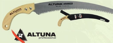
SERRUCHO CURVO J425 ALTUNA COMMIT 330 mm. Dentado japonés. Con funda. Ref. J425 | 9,83 € + IVA = 11,90 € | Ref. 16.37